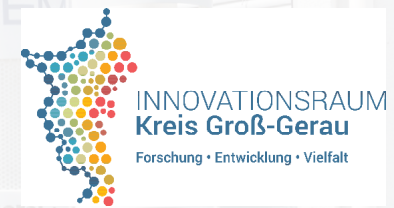
Teilausschnitt des Kreises Groß-Gerau